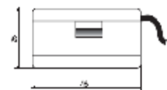
Príložený snímač s káblom P15x